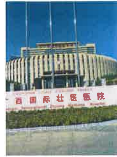
modernste Uni-Klinik mit TCM- Apotheke in Guangxi /Südchina

Nun suchen wir Partner, die diese TCM-Philosophie weiterführen. Wir sind für die verschiedensten Möglichkeiten der Vermarktung aufgeschlossen. Voraussetzung allerdings ist, dass der Qualität wie bisher höchste Priorität eingeräumt wird.