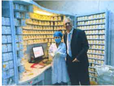
moderne chinesische Apotheke